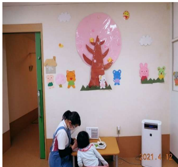
保育室みどりで看護師さんが投薬中